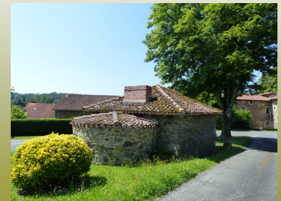
Four à pain. Ce four réhabilité en 2004, est remis chaque année en service pour la fête de l'âne