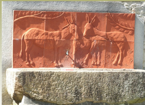
Bas-relief réalisé en 2004 situé sur la place des Platanes près de l'entrée du cimetière.