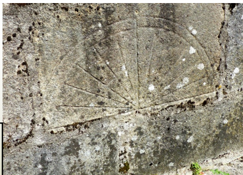
Cadran solaire gravé sur une pierre à l'arrière de l'église de Saint Paul .

Activité 1 : 41 platanes Activité 2 : Cèdre de l'Atlas—Noyer noir—Douglas vert—Bouleau verruqueux—pin sylvestre—hêtre—chêne rouge—charme—Auline glutineux - fusain d'Europe—Epicéa de Sitka Activité 3—sur la croix Activité 4—(a) 3 b) les indésirables c) le gouvernement français de Vichy d) les carottes e) 75 f) Jean Cavailles g) Le Général de Gaulle h) Les résistants le 11 juin 1944 Activité 5 : le mot menhir est mal écrit (inversion du n et du h) - hauteur 5m20 Activité 6 : bois—terre cuite—bardeaux de châtaignier