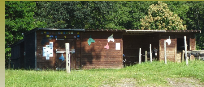
Asinerie des Pradelles. gérée par l'association "Saint Paul Ânes"