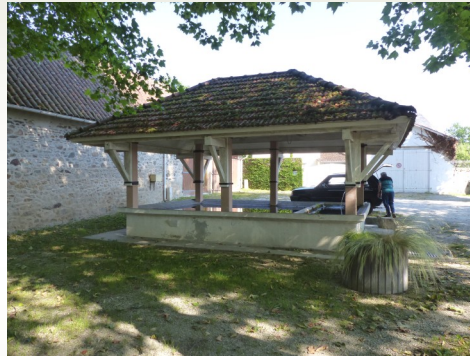
Place des Platanes où se déroulent les festivités et notamment la fête de l'âne le troisième dimanche du mois de mai.