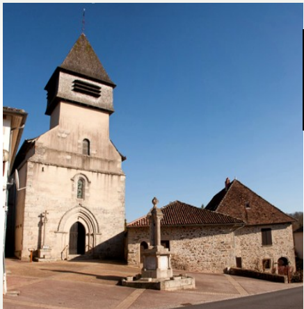
Église de Saint Paul datant du XIIIème siècle. Le monument aux morts y est placé devant.