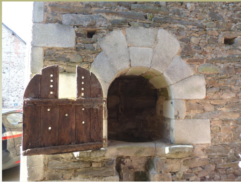
Puits de la grange , rue du Moulin. Le puits se trouve derrière un volet dans le mur de la grange