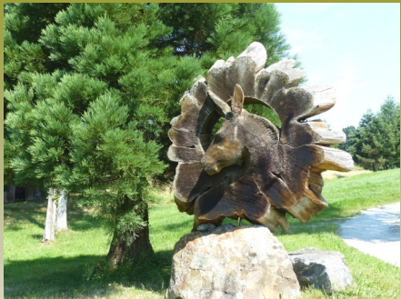
Statue de l'âne située à l'étang des Pradelles.