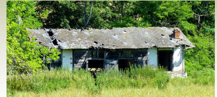
Vestige du camp d'internement de Saint Paul d'Eyjeaux, construit pour la seconde guerre mondiale.