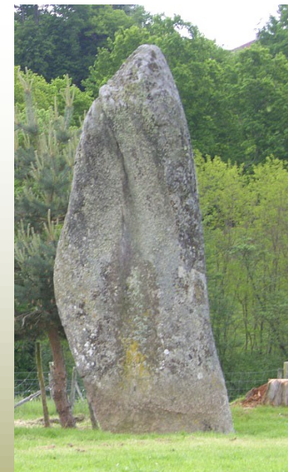
Menhir du Métayer , mesurant plus de 4 m de haut. Il témoigne du néolithique.