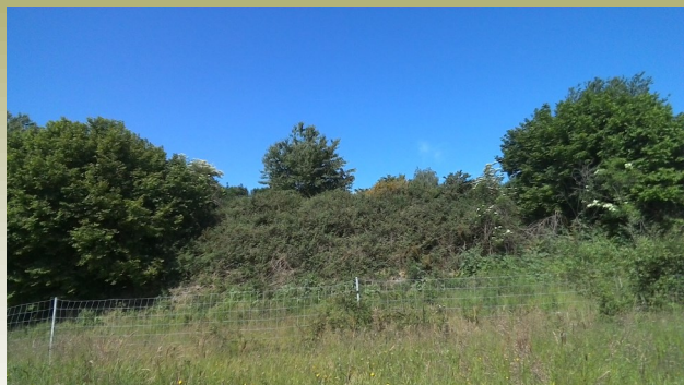
Le talus aux animaux (point 1)