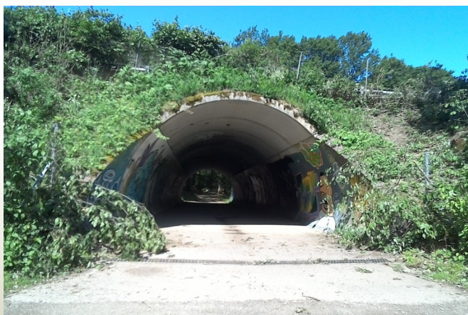
Le tunnel (point 2)