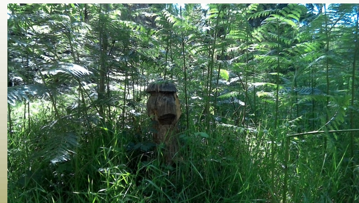
Sculpture de champignon (point 9)