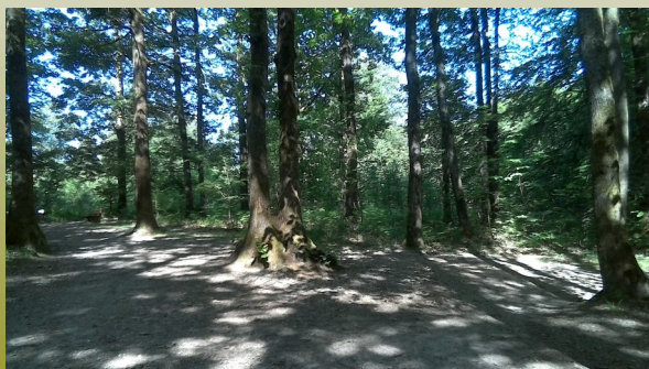
Début des chemins (point 3)