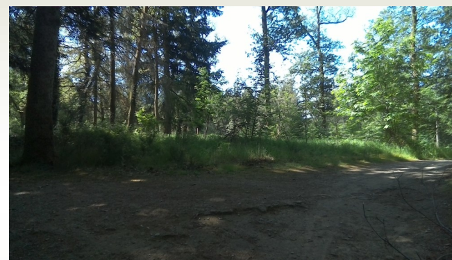
La clairière (point 8)