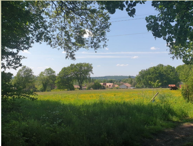
Vue d'un hameau d'Isle